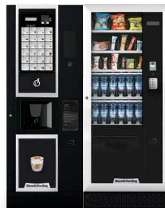
LEI400 EASY + ARIA M MASTER

LEI400, distribuidor automático de bebidas calientes con capacidad de 400 vasos y panel de selección directa con 24 selecciones (versión Easy y Smart). Diseñado para intercambiar fácilmente el panel de selecciones y adaptarse a diferentes ubicaciones.